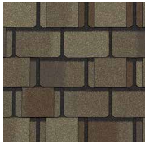
Bois délavé Weathered Wood