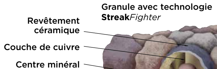
Diagramme uniquement à des fins d'illustration.

Ces stries que vous voyez sur les autres toits du voisinage? Ce sont des algues, une nuisance visuelle commune sur les toits de toute l'Amérique du Nord. La technologie StreakFighter de CertainTeed utilise la puissance de la science pour repousser les algues avant qu'elles puissent s'installer et se répandre. Le mélange granulaire StreakFighter's inclut du cuivre, qui résiste naturellement aux algues, et aide votre toit à conserver son esthétisme et sa belle apparence pour les années à venir.