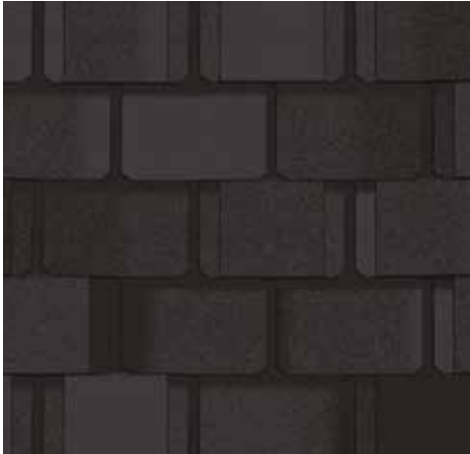
Noir granit Black Granite