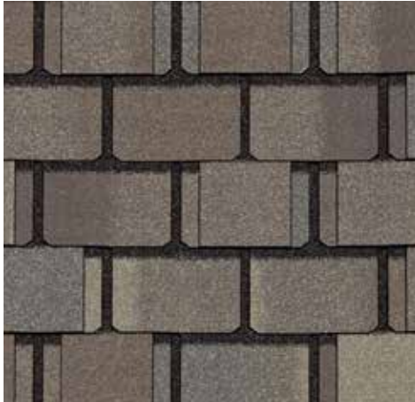
Ardoise guérite Gatehouse Slate