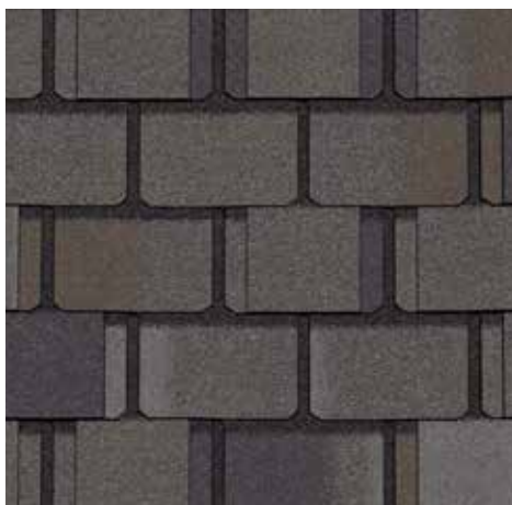
Gris bouclier Stonegate Gray