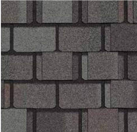
Ardoise coloniale Colonial Slate