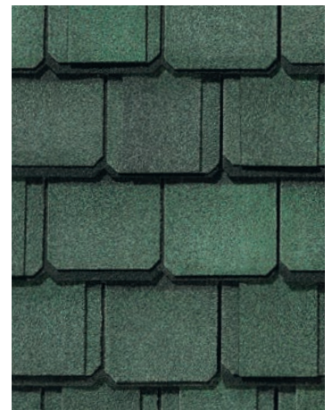
Sherwood Forest Forêt de Sherwood