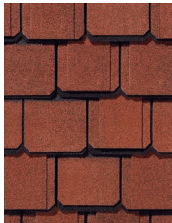
Georgian Brick Brique géorgienne