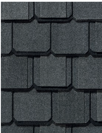
Black Pearl Perle noire