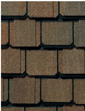
Brownstone Grès brun