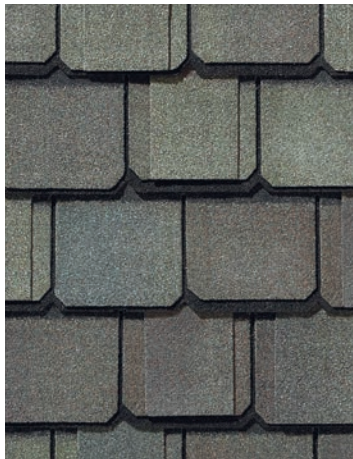
Gatehouse Slate Ardoise guérite