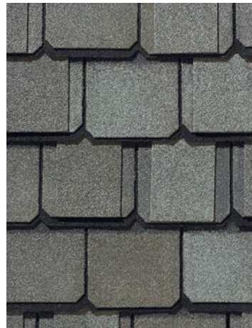
Stonegate Gray Bouclier