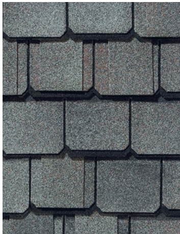
Colonial Slate Ardoise coloniale