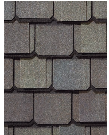
Weathered Wood Bois délavé